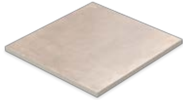
Gartenplatte 60 x 60 x 2 cm Domicil 20 hellbraun matt (598 x 598 x 20 mm) rektifiziert Trittsicherheit R 10 D266.F04M