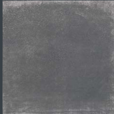
Domicil anthrazit matt