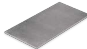
Boden- und Wandfliese 30 x 60 cm Domicil anthrazit matt (300 x 600 x 10 mm) rektifiziert Trittsicherheit R 10 D036.F05M