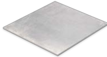
Boden- und Wandfliese 60 x 60 cm Domicil grau matt (600 x 600 x 10 mm) rektifiziert Trittsicherheit R 10 D066.F02M