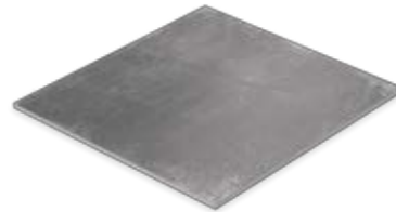
Boden- und Wandfliese 60 x 60 cm Domicil anthrazit matt (600 x 600 x 10 mm) rektifiziert Trittsicherheit R 10 D066.F05M