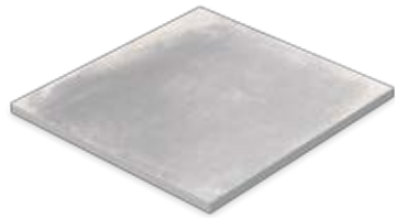
Gartenplatte 60 x 60 x 2 cm Domicil 20 grau matt (598 x 598 x 20 mm) rektifiziert Trittsicherheit R 10 D266.F02M