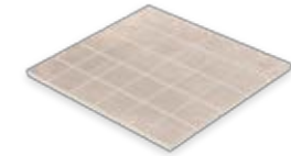
Mosaik 30 x 30 cm (5,0 x 5,0 cm) Domicil hellbraun matt (300 x 300 x 10 mm) rektifiziert Trittsicherheit R 10/B D033.M04M