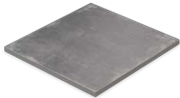
Gartenplatte 60 x 60 x 2 cm Domicil 20 anthrazit matt (598 x 598 x 20 mm) rektifiziert Trittsicherheit R 10 D266.F05M