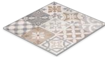
Dekor 60 x 60 cm Domicil Volledkor matt (600 x 600 x 10 mm) rektifiziert Trittsicherheit R 10 D066.D99M