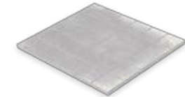
Mosaik 30 x 30 cm (5,0 x 5,0 cm) Domicil grau matt (300 x 300 x 10 mm) rektifiziert Trittsicherheit R 10/B D033.M02M