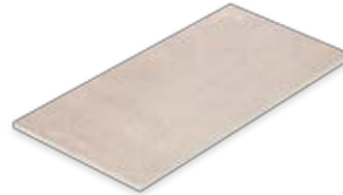
Boden- und Wandfliese 30 x 60 cm Domicil hellbraun matt (300 x 600 x 10 mm) rektifiziert Trittsicherheit R 10 D036.F04M