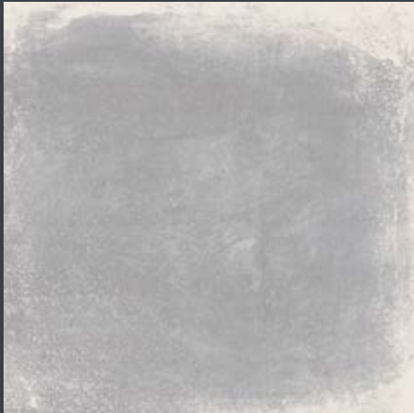
Domicil grau matt