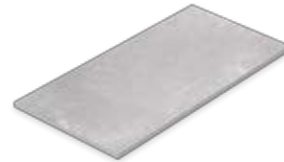
Boden- und Wandfliese 30 x 60 cm Domicil grau matt (300 x 600 x 10 mm) rektifiziert Trittsicherheit R 10 D036.F02M