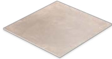
Boden- und Wandfliese 60 x 60 cm Domicil hellbraun matt (600 x 600 x 10 mm) rektifiziert Trittsicherheit R 10 D066.F04M